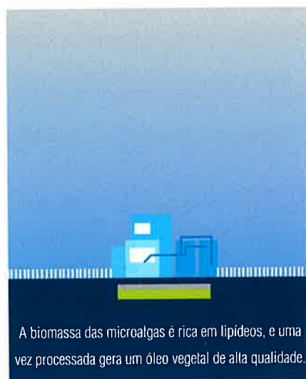
A biomassa das microalgas é rica em lipídeos, e uma vez processada gera um óleo vegetal de alta qualidade.