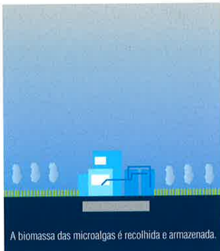
A biomassa das microalgas é recolhida e armazenada.